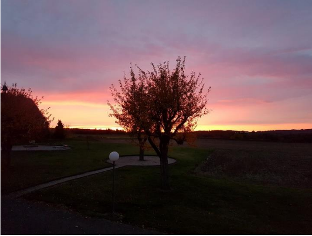
(Bibel-Wochenende in Vallendar, Okt. 2020)

Nachrichten der Katholischen Gehörlosengemeinde im Bistum Trier